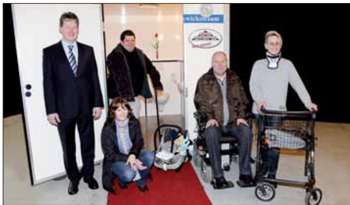
Die mobile WC-Anlage für Menschen mit körperlicher Behinderung kann kostenlos gemietet werden.

Finanziell unterstützt wird dieses Projekt von Firmen aus dem Landkreis, die als kleine Anerkennung eine kostenlose Werbefläche auf dem Toilettenwegweiser erhalten.